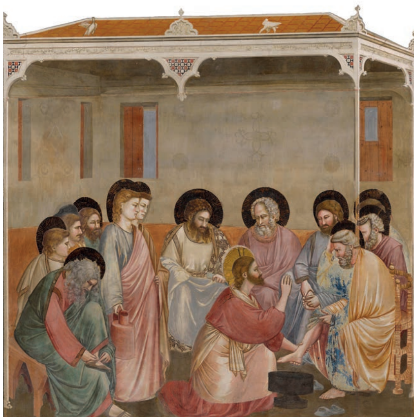
Giotto, Lavanda dei piedi , affresco, Sec. XIV, Noto, Padova, Cappella degli Scrovegni.